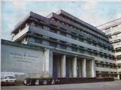
Instalación del Instituto de Higiene para incorporar nuevas tecnologías en la fabricación de vacunas.

«Para ello la tecnología que vamos a generar es un programa de investigación donde se vinculan los académicos, los técnicos, en particular los de genética biomédica, que nos permitan vincularse con Europa global y re-